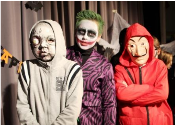
Halloween am Gymnasium Olching 2019